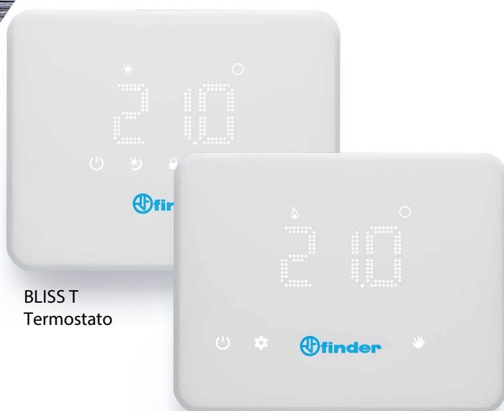
BLISS T Termostato